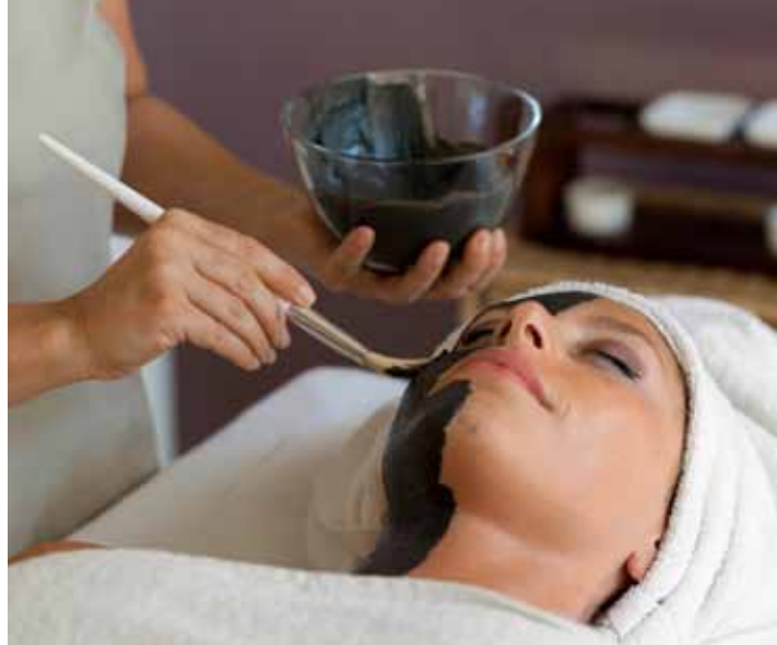
Terme San Giovanni (Li): trattamento viso collo e idromassaggio.

DA NON PERDERE: una seduta di 30 minuti nella Stanza del sale, con benefici pari a 3 giorni di mare.