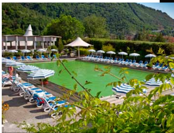
Terme Luigiane (Cs): la piscina termale e il rigoglioso giardino.

Appreziate per l'azione antinfiammatoria, sono benefiche per otiti, tonsilliti, faringiti, riniti e problemi all'apparato genitale femminile. All'esterno si allunga il rigoglioso Parco Termale Acquaviva, un'oasi verde e fiorita, con 3 piscine termali (da 32° a 34°) provviste di nuoto controcorrente, idromassaggi e turbodocce, più due vasche di acqua dolce. La "cittadella" della salute include 4 hotel e il Centro Benessere Acquaviva, che propone trattamenti