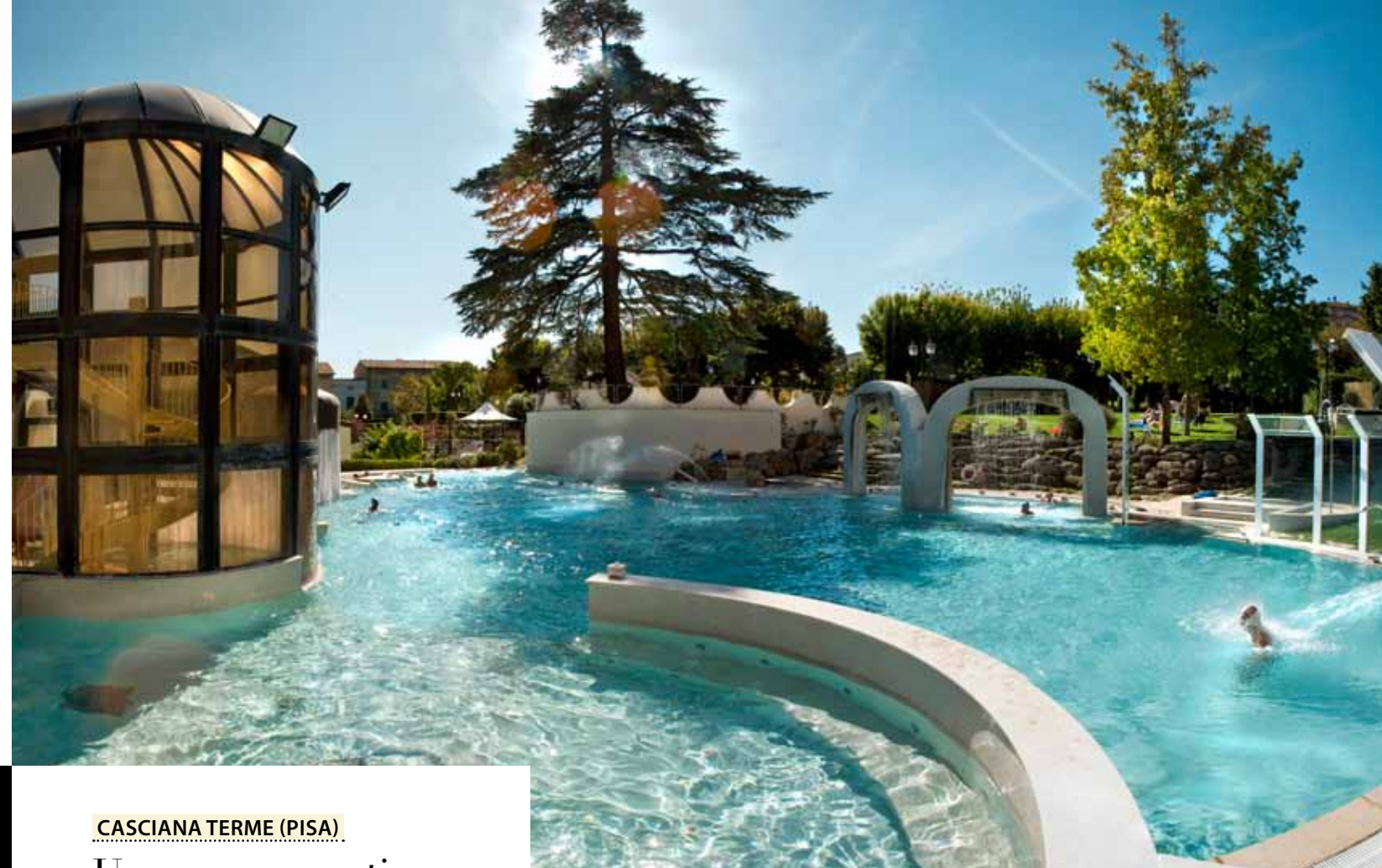
Terme di Casciana (Pi). Sopra e a destra: la piscina esterna, grande e scenografica, di giorno in mezzo al verde del parco, di notte sotto le stelle. Sotto: trattamenti al centro benessere.

OFFERTA TERME: speciale per F, sconto del 20 per cento su tutti i trattamenti benessere praticati nel complesso termale (tel. 0587.644608, www.termedicasciana.com ).