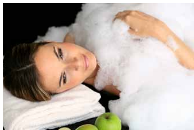
Terme Merano (Bz), la piscina esterna. A sinistra: peeling con schiuma di sapone alla mela. Sotto: Bagno di Sissi al siero di latte biologico, per due.

OFFERTA TERME: il pacchetto Day Spa, da 59 euro, prevede una giornata termale con molti benefit, tra cui: welcome drink, ingresso alle piscine/saune, sdraio, sconto 10 per cento sui trattamenti alla Spa (tel. 0473.252000, www.termemerano.it ).