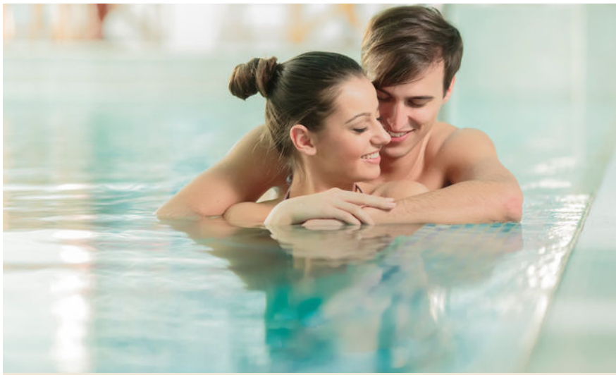
Capodanno alle Terme, coppia in piscina

La natura si risveglia, ma anche la pelle. Ecco gli indirizzi che urlano benessere